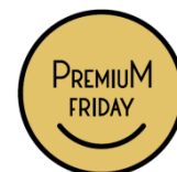
英文ロゴマーク(メイン)

「プレミアムフライデー」の文字がマークと一体化した使いやすいデザインで、企業・団体が最適なマークを選択できるよう英文、和文の2タイプのロゴを作成。背景カラーも状況に応じて活用できるように、様々なバリエーションを用意しました。また、デザインも各社・各団体が自由にカスタマイズできるようにしました。