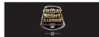
オリジナル手ぬぐい