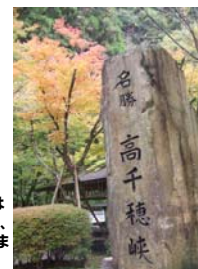
高千穂峡。見頃のピークは例年11月中旬頃であるが、天候によっては12月上旬まで楽しめるとのこと。