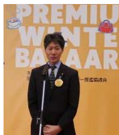
スピーチされる経済産業省 磯崎 仁彦 副大臣