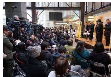
当日は大勢のマスコミ、一般のお客様で賑わいました