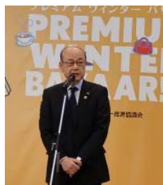
イベントの趣旨を説明する赤松会長