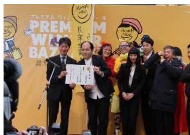
吉本坂46「プレミアムフライデー 応援隊」就任式