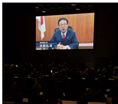
世耕大臣からビデオメッセージをいただきました