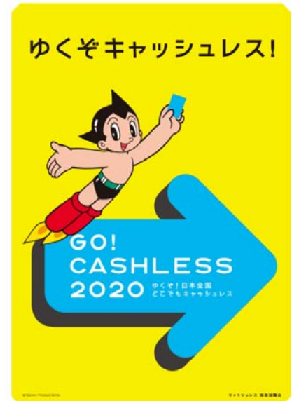
イメージキャラクター「鉄腕アトム」を活用した キャッシュレス普及ポスター

消費者・事業者双方に効果的な「プレミアムフライデー」と「キャッシュレス化」を一体的に推し進めるべく、プレミアムフライデー推進協議会としても、各社が実施するキャンペーン情報を収集し発信していくなど、その推進に向け、キャッシュレス推進協議会と連携して取り組んでまいります。