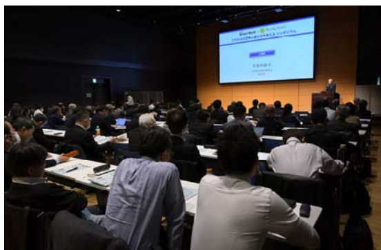
会場には約300人の参加者が集まりました