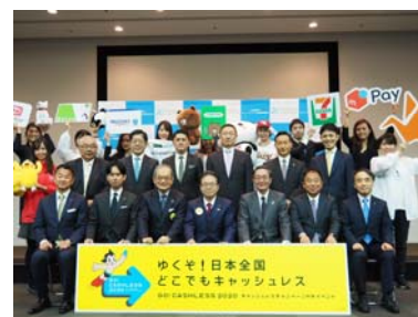
フォトセッションの様相

また、会場では本キャンペーン参画企業30社による、キャッシュレス体験のできるブース展示も実施しました。こちらは多くの取材メディアの方々に加え、経済産業省の職員や近隣の官公庁職員で賑わいました。